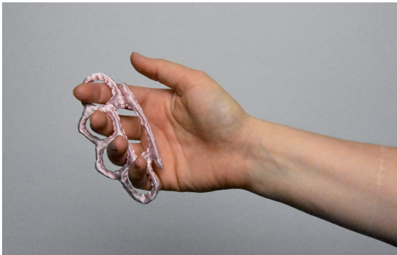
Soft Series: Brass Knuckles Foto print op aluminium, diverse maten 2017

Deze met de hand genaaide wapens zijn onderdeel van Overheuls doorlopende project Soft Series. De objecten zijn gemaakt van satijn en gevuld met sesamzaad en gedroogde lavendel voor de geur. De kunstenaar begon met een replica van een Kalasnikov. Met deze objecten zoekt Overheul naar het contrast tussen de originele en huidige staat van elk wapen: schadelijk en dodelijk versus zacht en totaal nutteloos, behalve de visuele schoonheid ervan.