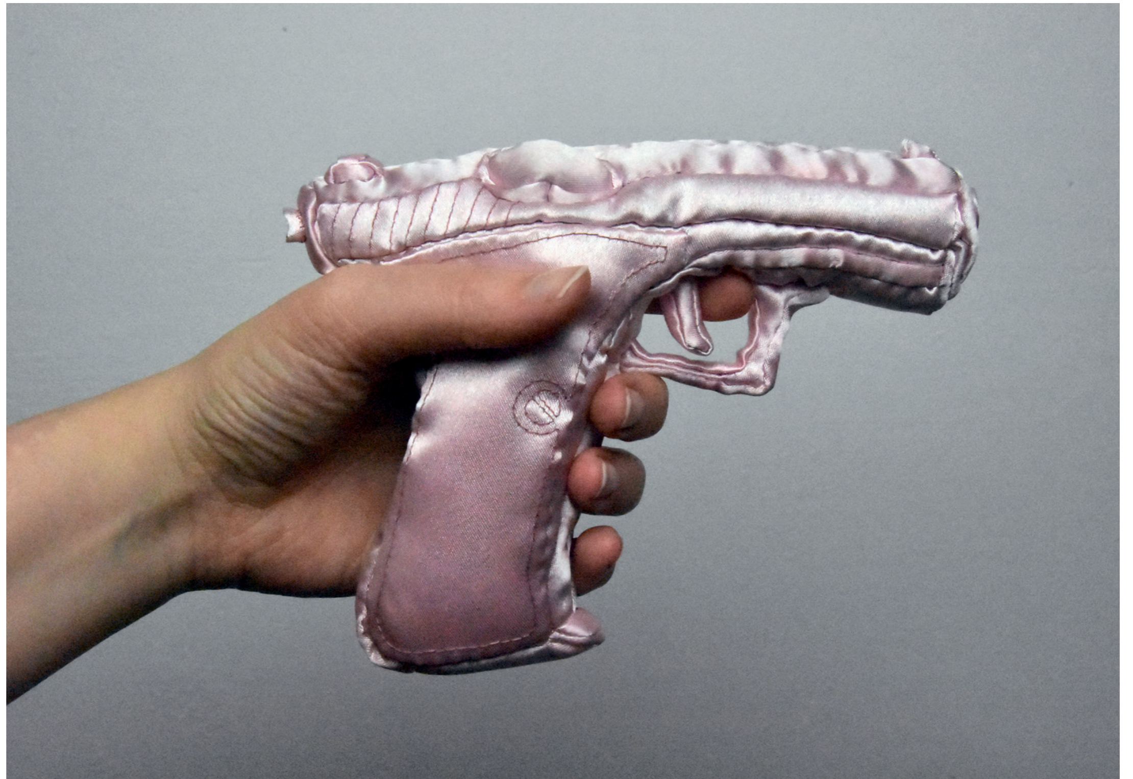
Soft Series: Heckler&Koch P7 Foto print op aluminium, 60x40 cm 2017