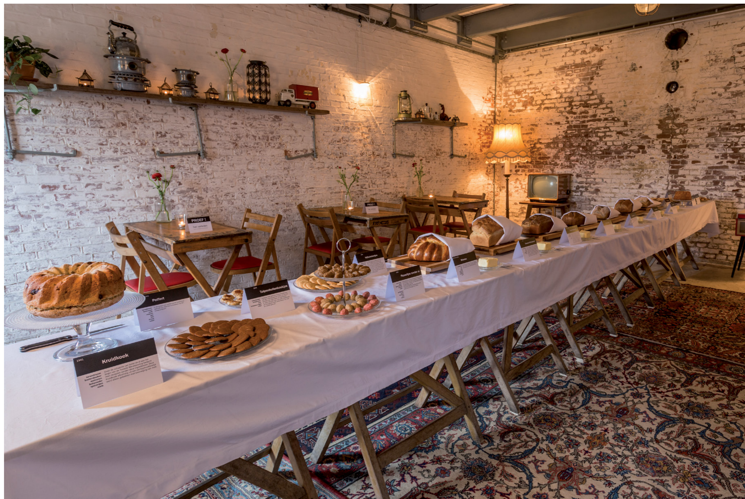
Brood Nodig, 2017 Buffet, Fort Maarsseveen