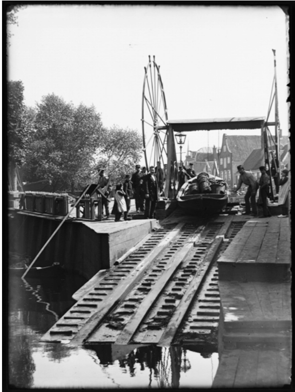
Overhaal van de Slotervaart naar Kostverlorenvaart, gezien in oostelijke richting.