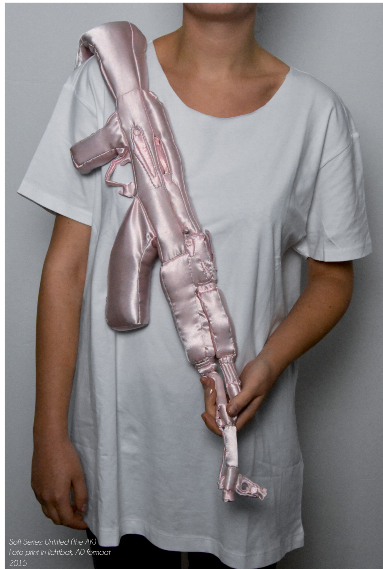
Soft Series: Untitled (the AK) Foto print in lichtbak, A0 formaat 2015