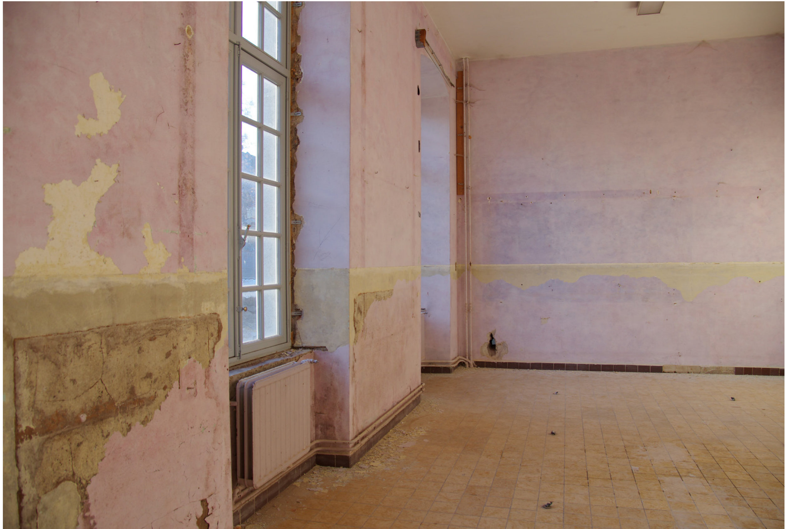
Peil, 2017 Interventie, Leuven Festival ITHAKA # 25